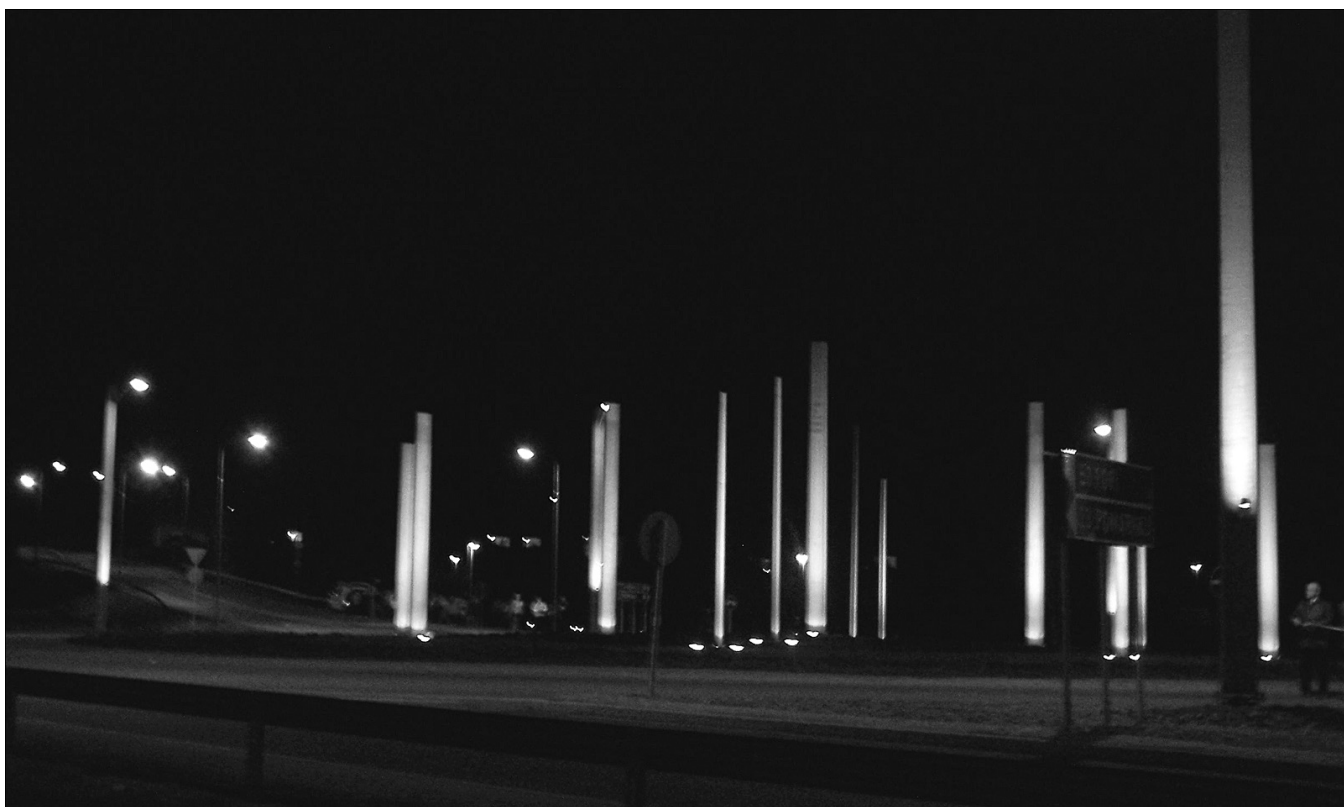
Valometsän tunnelmaa pimeässä.