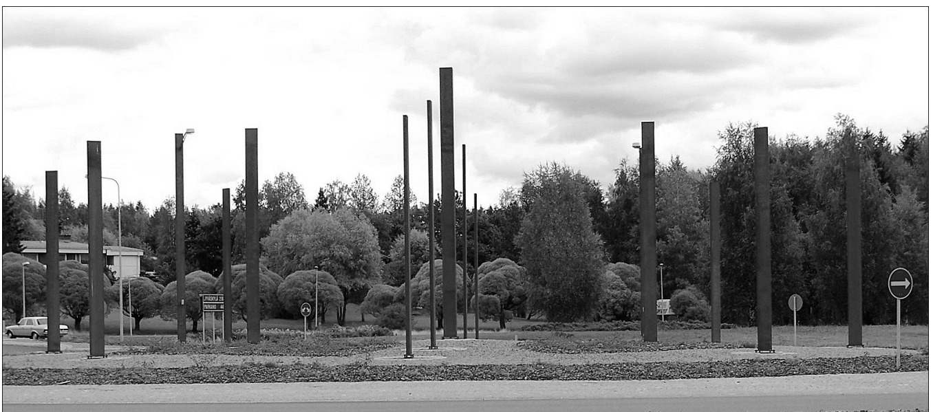
Valometsä päivällä. Ruosteenpunaisina hehkuvat pilarit viittaavat kankaanpääläiseen kangasmetsään.