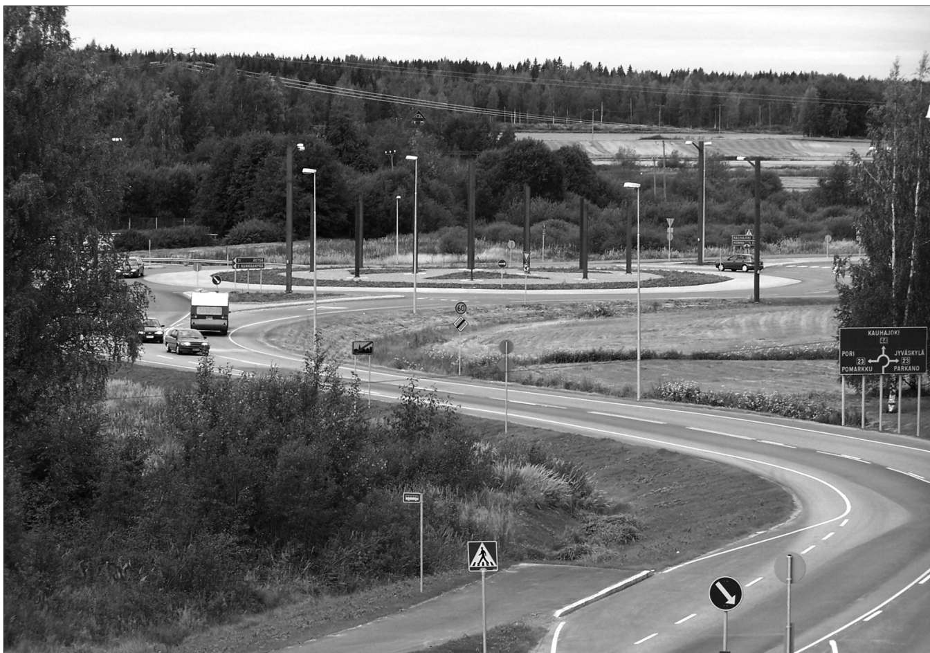
Kankaanpään liittymä ja Valometsä kuvattuna rautatiesillalta.