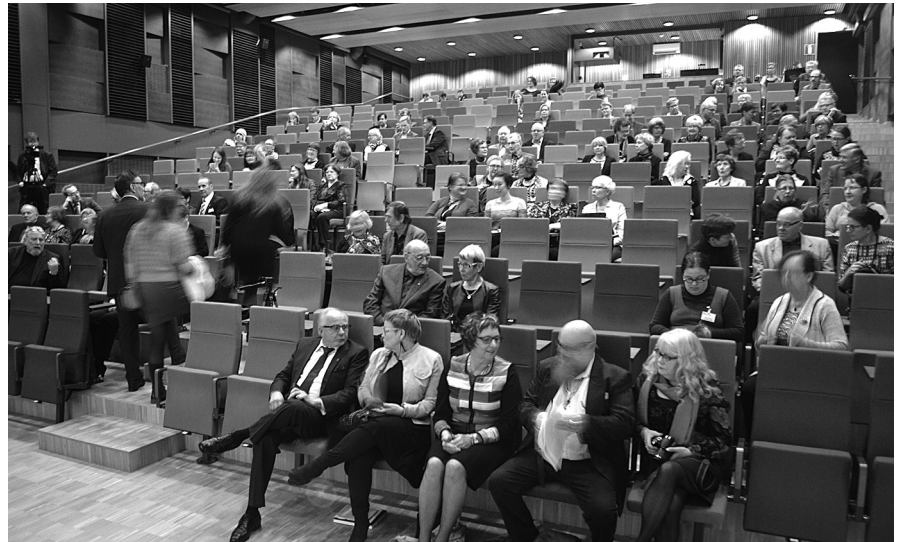
Uusittu Kankaanpääsalisi tarjosi bienot puitteet taideyhdistyksen 50-vuotisjuhlaseminaarille 16.1.2015. Runsaslukuinen yleisö oli todistamassa Taiteen Juhlavuoden avausta.