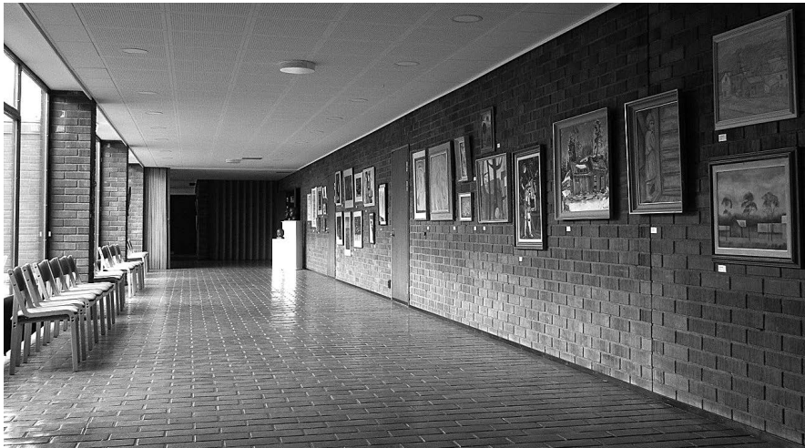
Juhlatalo Artellin valoisa aula on kuin luotu näyttelytilaksi.

Hanke toteutti itsenäisyyden juhluvuoden yhdessä-teemaa monipuolisesti, lähtien jo valmisteluprosessista ja johtaan yhteisöllisiin ja vuorovaikutteisiin tapahtumiin taiteen äärellä.