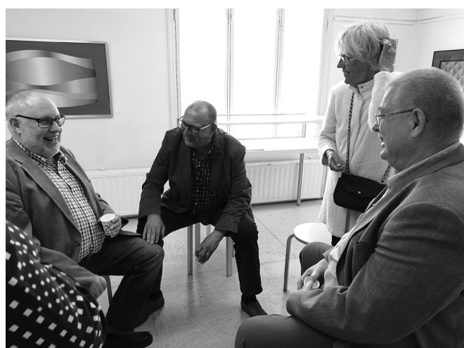
Avajaistunnelmia Kankaanpään Galleriassa 5.6.2018.