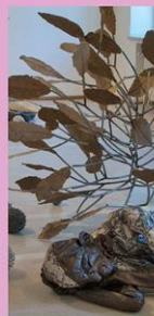
Heli Ryhänen, Outoa kiertäjä, 2017, teiks, paperi, teikomätkä, yksityisellä