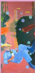
Petri Rummukainen, Great Wall, 2018, öljy kankaalle, yksityisellä

Tervetuloa näyttelyn avajaisiin pe 5.10. klo 18-20