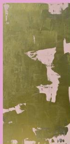
Ulla Karsikas, Kesän alkua, 2018, akryyli-maali levyille, yksityisellä