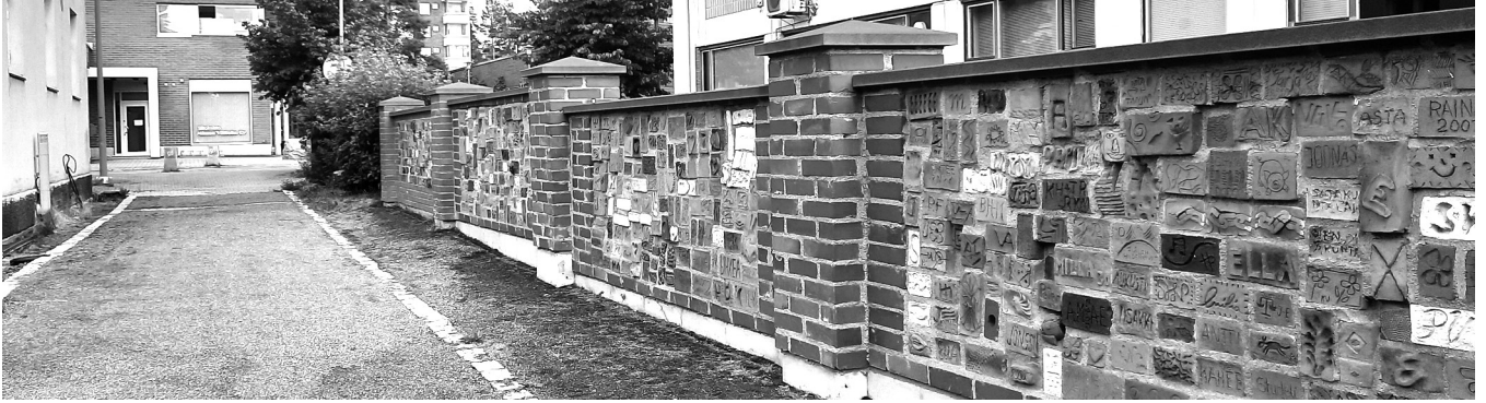
Puumerkkitiilimuuri ennen kuin sitä kesällä 2021 jatkettiin Torikadulle asti.

Kankaanpään taideyhdistys haastoi keväällä kaupunkilaisia muovailemaan oman pysyvän jälkensä Taidekehälle. Puumerkkitiilityöpajat saivatkin varsin innostuneen vastaanoton ja persoonallisia puumerkkitiiliä syntyi lähes 500 kpl. Taidekehällä sijaitsevaa Puumerkkitiilimuuria jatkettiin Torikadulle asti. Osa tiilistä jäi vielä seuraavaan vaiheeseen.