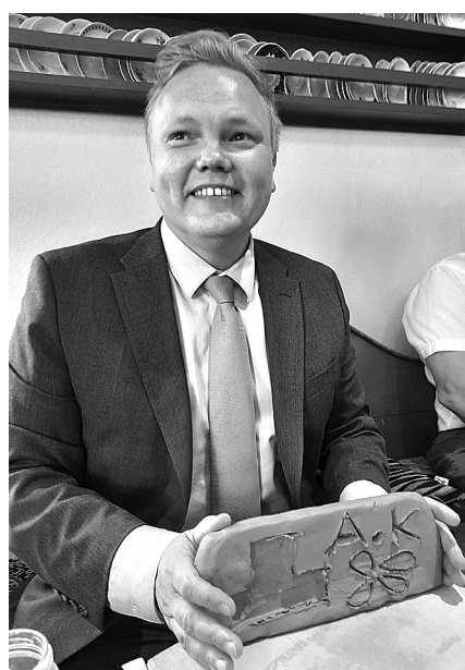
Ministeri Antti Kurvinen muovaili vierailullaan ministerin batun, nimikirjaimensa sekä keskustapuolueen neliapilan.