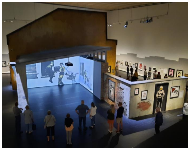
Banksyn näyttelyssä Mäntän Gösta-paviljongissa