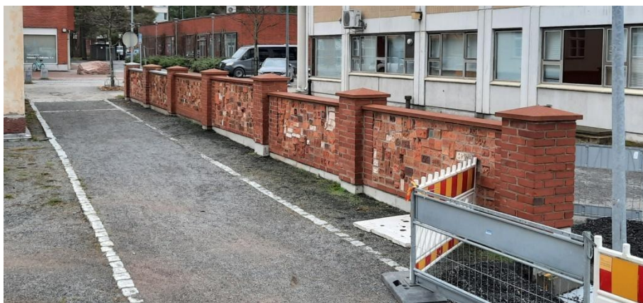
Puumerkkitiilimuri kesän 2021 talkoiden jälkeen. Kaupunki teki syksyllä perustukset seuraavaan vaiheeseen (aitaus oik.)

Puheenjohtaja laati hankkeesta Kankaanpään Jouluun artikkelin "Kädet saveen" , mikä on toimintakertomuksen liitteenä .