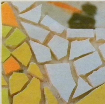
Taideleiriläiset testailivat mosaiikkia.