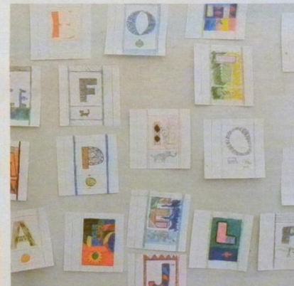
Monia omia kuvia ja kuvituksia ehti syntyään.