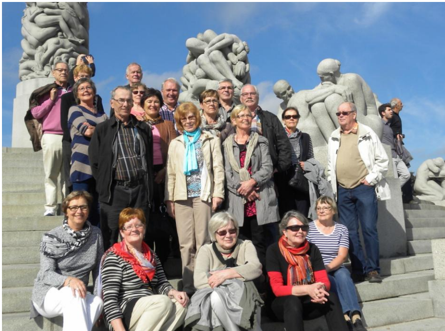
Vigelandin veistospuistoon tutustumassa.

Matka onnistui niin kesäisen sään kuin runsaan ohjelmankin puolesta erinomaisesti. Majoituimme Grand Hotelliin aivan kaupungin ytimessä. Bonuksena matkalaisille olivat samaan aikaan vietetyt ruokamessut, kirjamesut ja Kulturnatt iltotiluksineen.