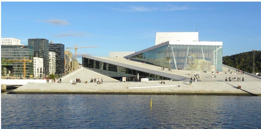
Osloon maineikas oopperatalo tarjosi elämyksiä niin sisällä kuin ulkona, suosituilla kattoterasseilla. Osloon ranta-alueet ovat uudistumassa. Oopperatalon lähelle rakennetaan lähivuosina mm. uusi Munch-museo ja kirjastotalo.