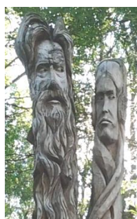
PORI, Tehdas ry ja Taidemuseo