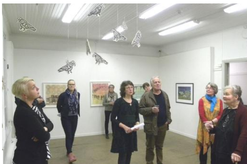
RAUMAN TAIDEGRAAFIKOT, kutsunäyttely Kankaanpään Galleriassa