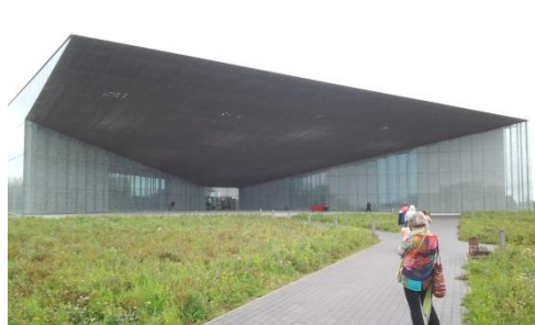
TARTTO, Viron Kansallismuseo ja Paavalin kirkko