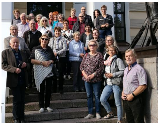
Ryhmämme Pietarissa Erartan portailla

Taidematka Pietariin järjestettiin 14.9.–16.9.2018 Allegro-junalla. Osallistujia 28. Aloitettiin Pietarin panoraamakierroksella jossa nähtiin mm. Talvipalatsi, lisäkin kirkko, Pietari-Paavalin linnoitus, Nevskin pääkatu, Kazanin kirkko ja Neva-joki. Tutustumiskohteina Verikirkko, nykytaiteen museo Erarta, Eremitaasin taidemuseo, Faberge-museo, lisäkin kirkko. Osa retkeläisistä osallistui Joutsenlampi-balettiin Mihailovski-teatterissa.