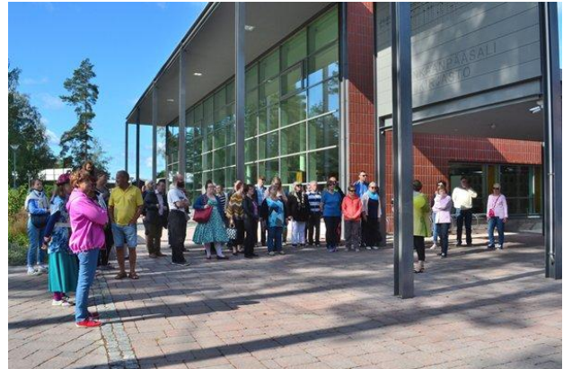
EHD-kierroksen osallistujia kirjaston edustalla

Petäjä-opiston vanhojen ikkunoiden kunnostuskurssille syyslukukaudella 2019 osallistui kuusi taideyhdistyksen jäsentä. Kurssilla kunnostetaan Gallerian ikkunoita. Kurssi jatkuu kevätkaudella 2020.