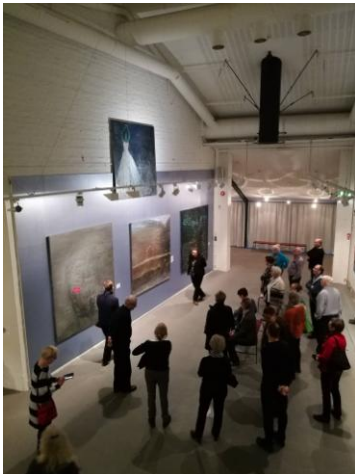
Yhdistyksen kolmella kotimaan taideretkellä oli osallistujia yhteensä 92.